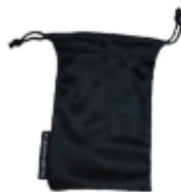
Microfibre storage bag