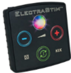
KIX Electro Sex Stimulator