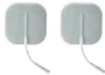
Self-adhesive conductive pads x 2